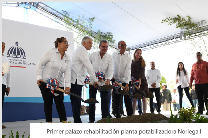
Primer palazo rehabilitación planta potabilizadora Noriega I