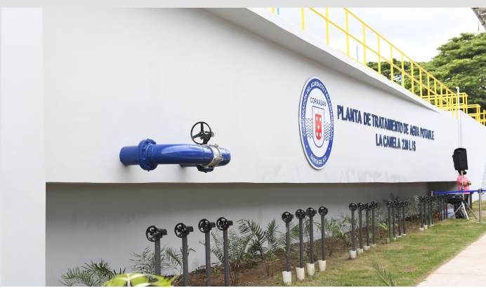
Puesta en operación Planta de Tratamiento de Agua Potable La Canela