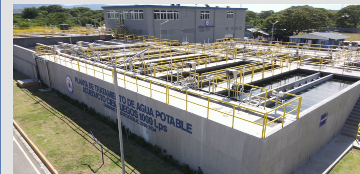
Puesta en operación del acueducto de Cienfuegos