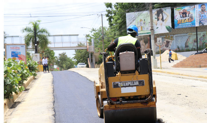
Construcción del colector de aguas residuales de la Av. 27 de Febrero