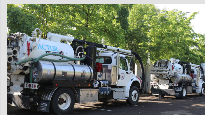
Adquisición de 3 camiones Vactor para limpieza del alcantarillado