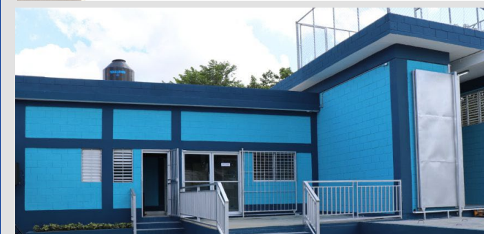
Rehabilitación de la estación de bombeo Don Pedro