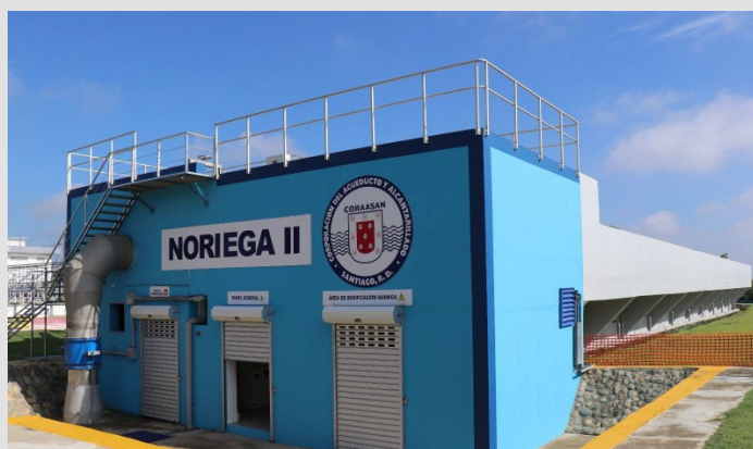
Rehabilitación de la Planta de Tratamiento de Agua Potable Noriega II