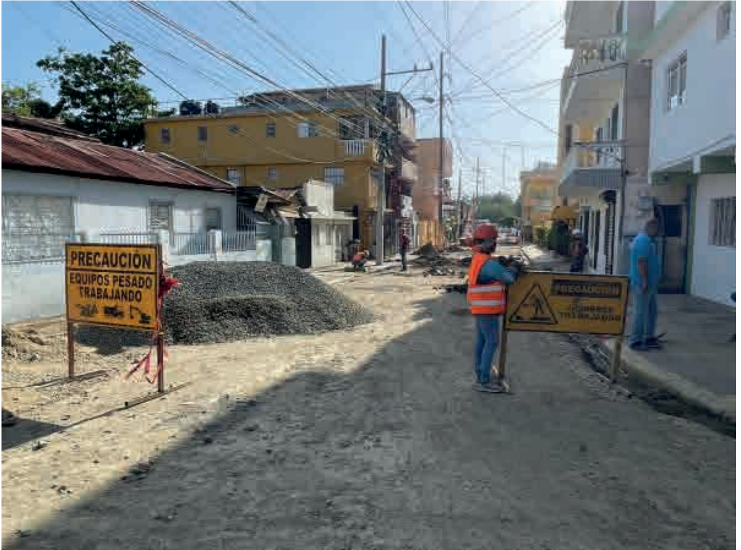
Residentes del ensanche Libertad valoran como positivo proyecto de mejoramiento del alcantarillado sanitario