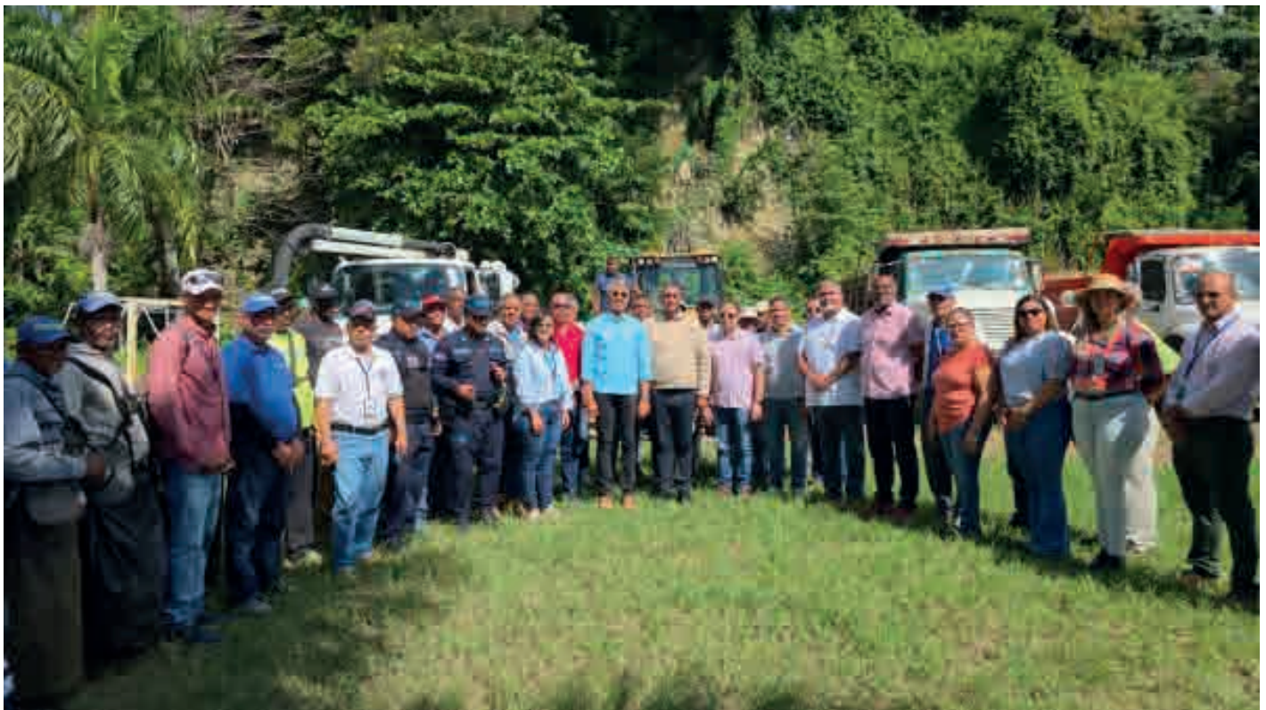
Coraasan, Medio Ambiente y Alcaldía de Santiago realizan jornada de recogida de desechos sólidos y limpieza de imbornales en la avenida del Arroyo.