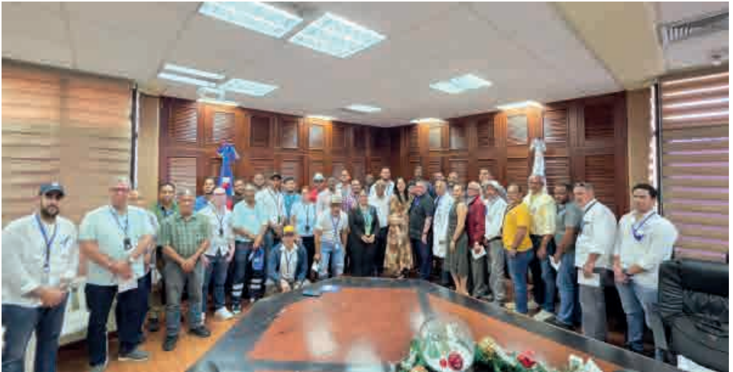
Coraasan imparte charla sobre prevención del Cáncer de Próstata, en el Día del Hombre.