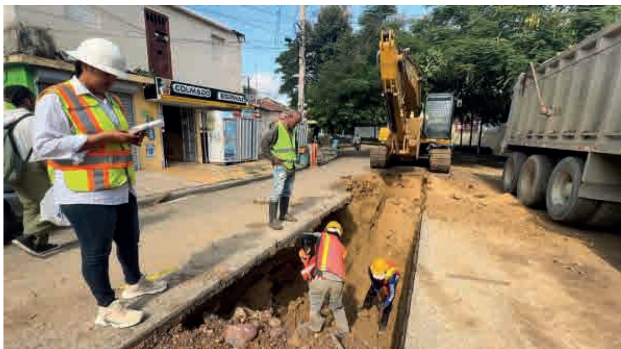
El colector de aguas residuales La Rosaleda impactará a 25 mil habitantes en Santiago.