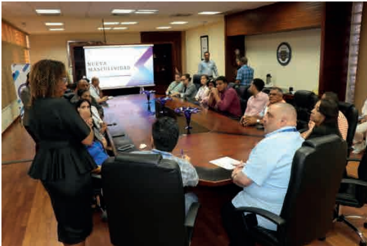
Coraasan apuesta a una “Nueva masculinidad” para contribuir a erradicar la violencia de género.